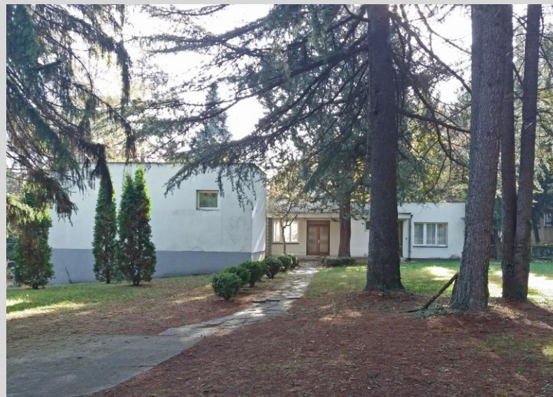
Инспирација за делото „Копнеж за Македонија“